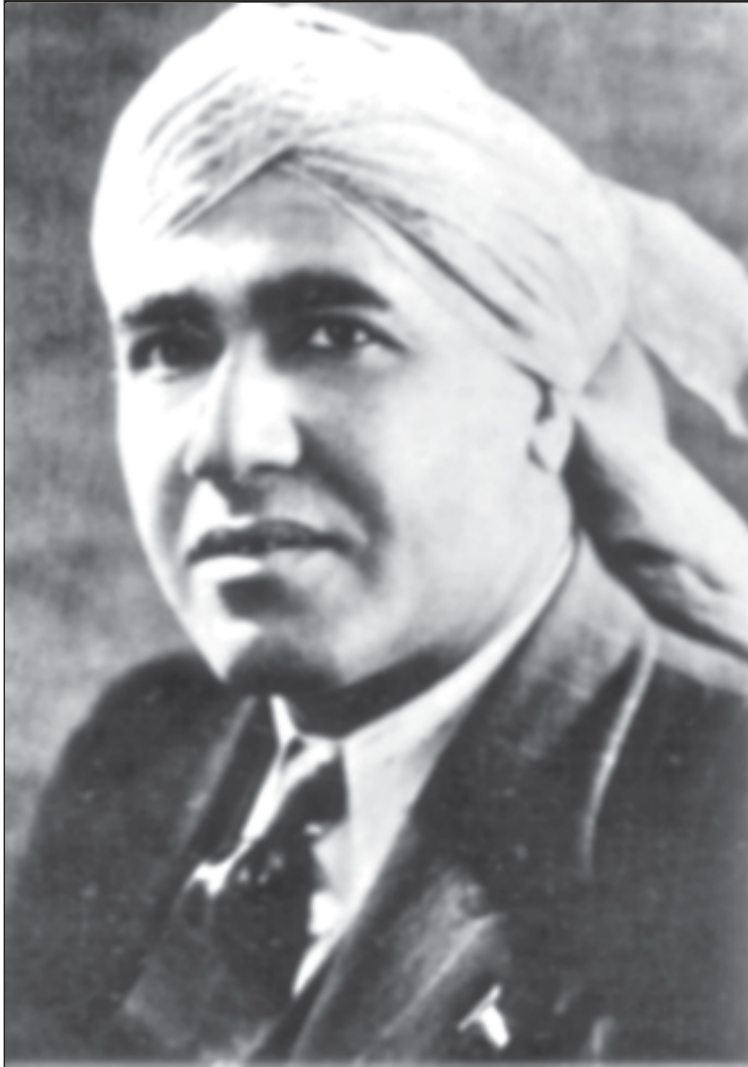
ਸ਼ਹੀਦ ਉਧਮ ਸਿੰਘ