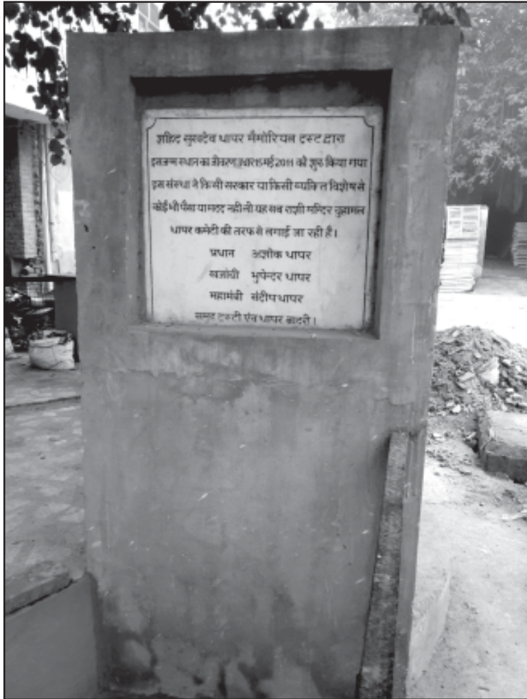
ਸ਼ਹੀਦ ਸੁਖਦੇਵ ਦੇ ਲੁਧਿਆਣਾ ਦੇ ਨੌਘਰਾ ਮੁਹੱਲੇ ਵਿਖੇ ਸਥਿਤ ਜੱਦੀ ਘਰ ਦੇ ਮੁਹਰੇ ਲੱਗਿਆ ਹੋਇਆ ਮੈਮੋਰੀਅਲ ਦਾ ਨੋਟਿਸ ਬੋਰਡ।