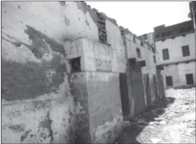
ਸ਼ਹੀਦ ਮਦਨ ਲਾਲ ਢੀਂਗੜਾ ਦੇ ਸ੍ਰੀ ਅੰਮ੍ਰਿਤਸਰ ਸਾਹਿਬ ਵਿਖੇ ਸਥਿਤ ਜੱਦੀ ਘਰ ਦੀਆਂ ਢਾਹ ਦਿੱਤੇ ਜਾਣ ਤੋਂ ਬਾਅਦ ਦੀ ਹਾਲਤ ਦੀਆਂ ਤਸਵੀਰਾਂ।

ਲਾਭ ਹੋਵੇਗਾ, ਨਾ ਕਿ ਸ਼ਹੀਦ ਮਦਨ ਲਾਲ ਢੀਂਗੜਾ ਦੇ ਪਰਿਵਾਰ ਨੂੰ। ਇਸ ਹਾਲਾਤ ਵਿੱਚ, ਪੰਜਾਬ ਸਰਕਾਰ ਨੇ ਇਹ ਫੈਸਲਾ ਕੀਤਾ ਹੈ ਕਿ ਸ਼ਹੀਦ ਮਦਨ ਲਾਲ ਢੀਂਗੜਾ ਦੀ ਯਾਦਗਾਰ ਉਸ ਦੇ ਜੱਦੀ ਘਰ ਵਾਲੀ ਥਾਂ 'ਤੇ ਨਾ ਬਣਾਈ ਜਾਵੇ।.....”