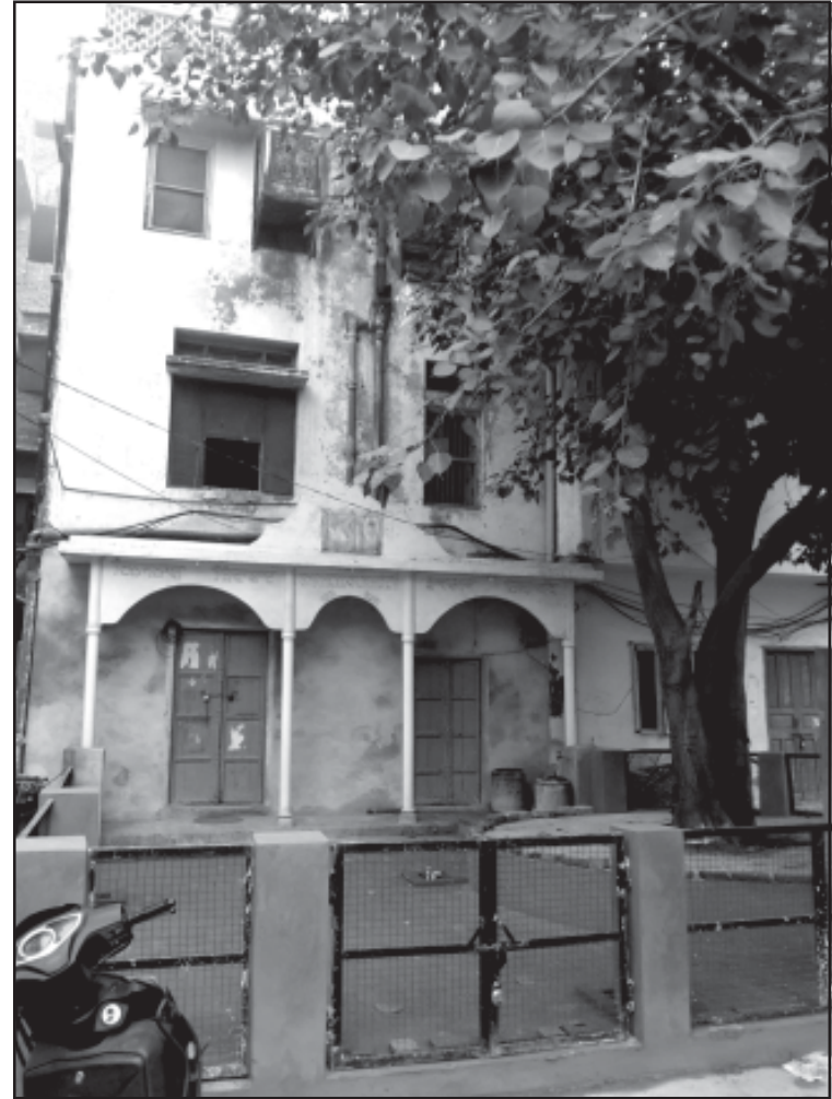
ਸ਼ਹੀਦ ਸੁਖਦੇਵ ਦਾ ਨੌਘਰਾ ਬਜ਼ਾਰ, ਲੁਧਿਆਣਾ ਵਿਖੇ ਸਥਿਤ ਜੱਦੀ ਘਰ, ਜਿਸ ਨੂੰ ਲੇਖਕ ਦੁਆਰਾ ਦਾਇਰ ਜਨ ਹਿਤ ਯਾਚਕਾ ਦੀ ਸੁਣਵਾਈ ਦੌਰਾਨ “ਸੁਰੱਖਿਅਤ ਸਮਾਰਕ ਘੋਸ਼ਿਤ ਕਰ ਦਿੱਤਾ ਗਿਆ।