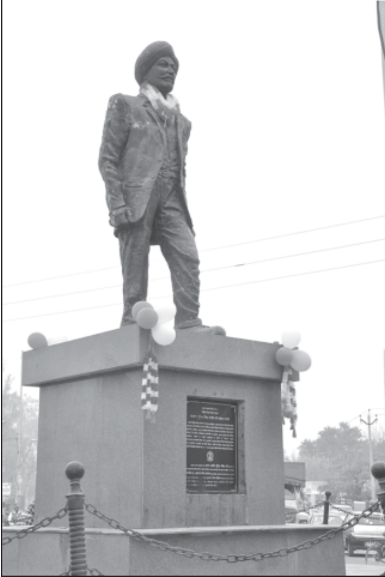
ਸੁਨਾਮ ਵਿਖੇ ਸ਼ਹੀਦ ਉਧਮ ਸਿੰਘ ਦਾ ਬੁੱਤ